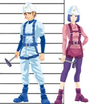
リバークル株式会社 イメージキャラクター